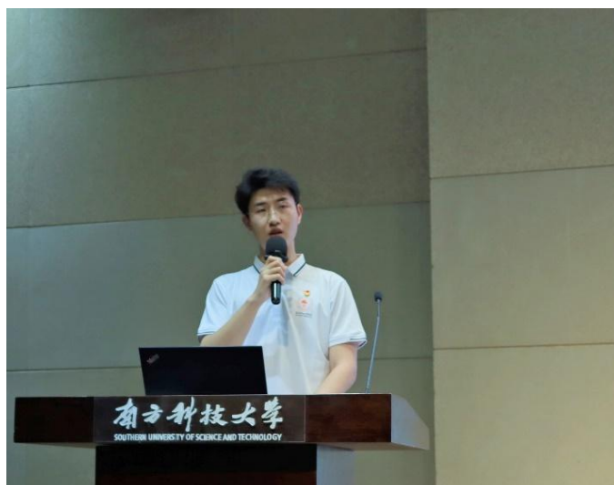
王梓进行第一届研究生会工作汇报